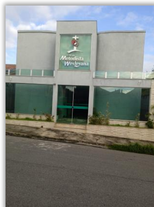
Igreja: IMW Venda Nova