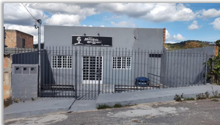
Igreja: IMW Vera Cruz de Minas