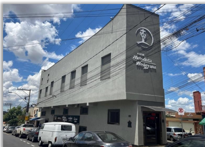
Foto da Fachada Igreja

O Distrito tem a sua sede localizada à Rua Barbará Heliodoro 65, Bairro Industrial, Contagem , sendo composto por diversas igrejas que abaixo quantificamos e qualificamos para uma melhor compreensão de como Deus tem trabalhado no distrito nesse biênio de 2023/2024.