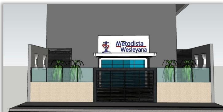
Foto da Fachada Igreja

O Distrito tem a sua sede localizada à Rua Manoel Mendes, 238 – Bairro Novo Amazonas, Betim-MG, CEP. 32685-146 , sendo composto por diversas igrejas que abaixo quantificamos e qualificamos para uma melhor compreensão de como Deus tem trabalhado no distrito nesse biênio de 2023/2024.