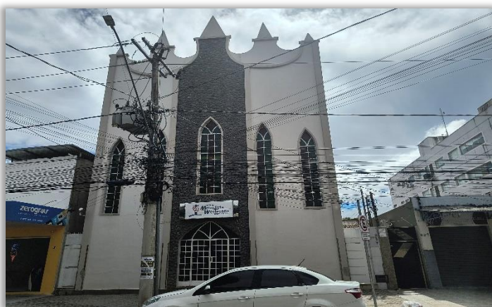
Foto da Fachada Igreja

O Distrito tem a sua sede localizada à Rua Peçanha, 989 Centro – Governador Valadares/MG , sendo composto por diversas igrejas que abaixo quantificamos e qualificamos para uma melhor compreensão de como Deus tem trabalhado no distrito nesse biênio de 2023/2024.