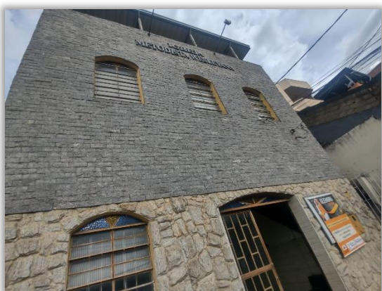
Foto da Fachada Igreja

O Distrito tem a sua sede localizada à Rua Capitão Bicalho, 714 – Juiz de Fora/MG , sendo composto por diversas igrejas que abaixo quantificamos e qualificamos para uma melhor compreensão de como Deus tem trabalhado no distrito nesse biênio de 2023/2024.