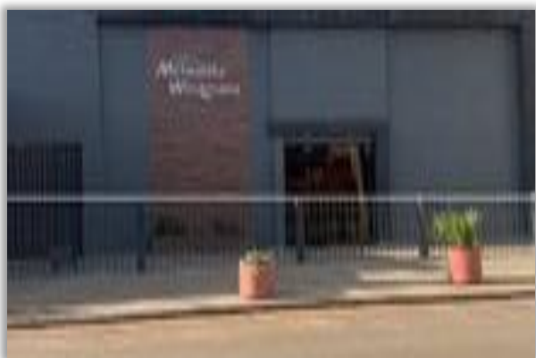
Foto da Fachada Igreja

O Distrito tem a sua sede localizada à Qd 63 lote 1, Centro – Santo Antônio do Descoberto – GO , sendo composto por diversas igrejas que abaixo quantificamos e qualificamos para uma melhor compreensão de como Deus tem trabalhado no distrito neste biênio de 2023/2024.