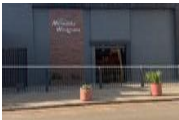
Foto da Fachada Igreja

O Distrito tem a sua sede localizada à Qd 63 lote 1, Centro – Santo Antônio do Descoberto – GO , sendo composto por diversas igrejas que abaixo quantificamos e qualificamos para uma melhor compreensão de como Deus tem trabalhado no distrito neste biênio de 2023/2024.